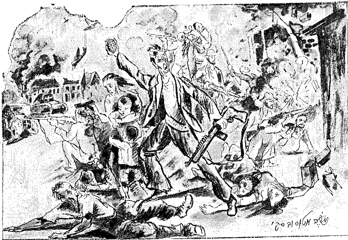
שער "הבקר לילדים" מאפריל 1944. החרדים מוצגים כלוחמים.

ראובן גלילין זה: מוררי הגיטו (שיר); בינינו... (מוקדש למרד הגיטו, למלאת לו שנה); ירושלים (שיר); יפת ניסן בארצנו; מאחרי הצאן... (סוף פרק עשירי); לקח הורים ומורים; שיחות צופים (ב. על שבטי ישראל - אשכנזים וספרדים); פלאי-פלאים (צמחים טורפים ופרטרי מות); סניף הדואר שלנו; חידה; ועוד.